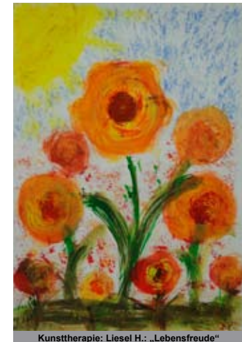
Kunsttherapie: Liesel H.: „Lebensfreude“

5. November 2010 14:30 - 19:00 Uhr Klinikum Großhadern München Hörsaal III und IV